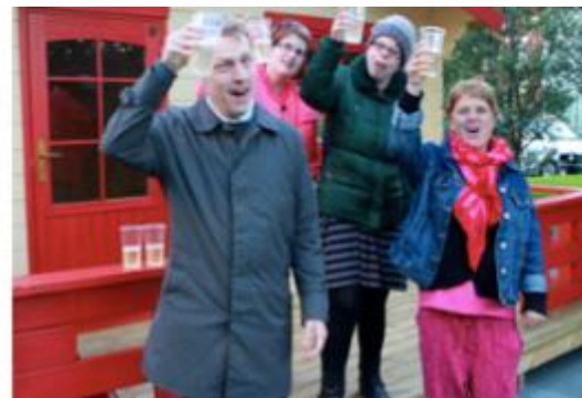
Skálum fyrir GÆS