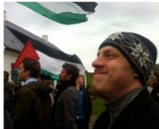
Samstöðufundur með Palestínu